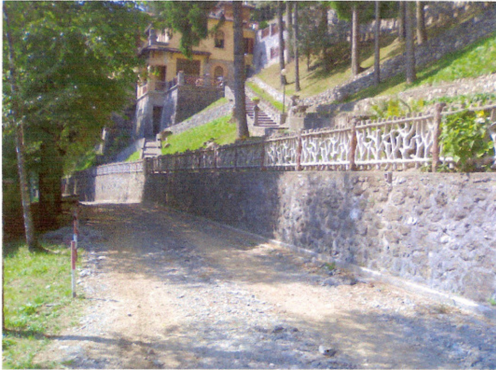
Tratto conclusivo degli interventi infrastrutturali alla Vetta.