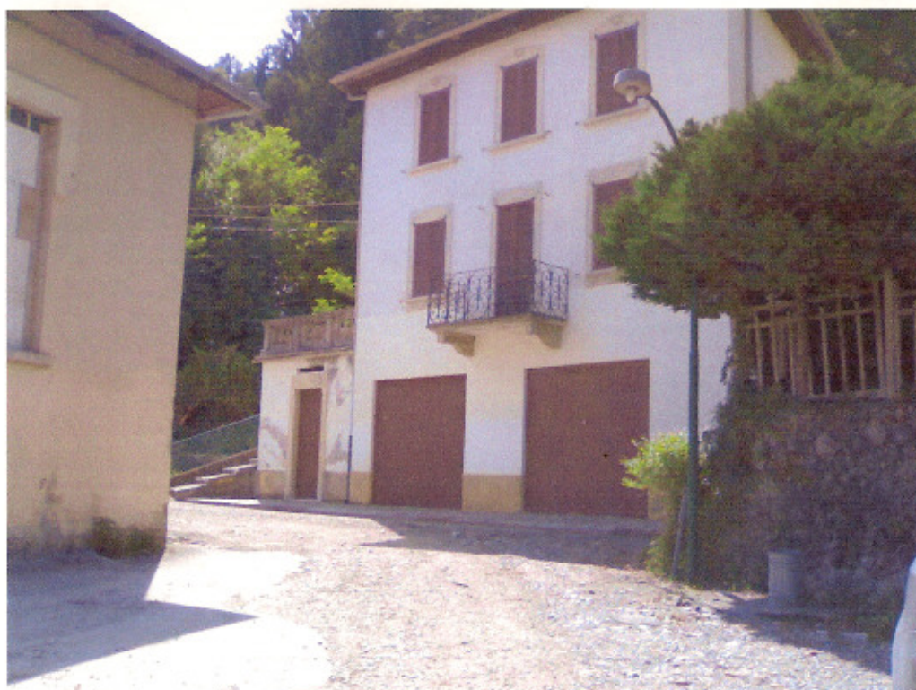
Opere di infrastrutturazione nei pressi della funicolare