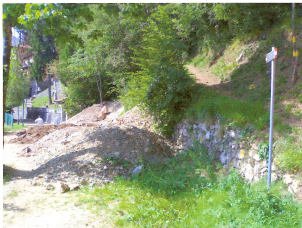
Termine delle opere di infrastrutturazione all'imbocco del sentiero per Sussia